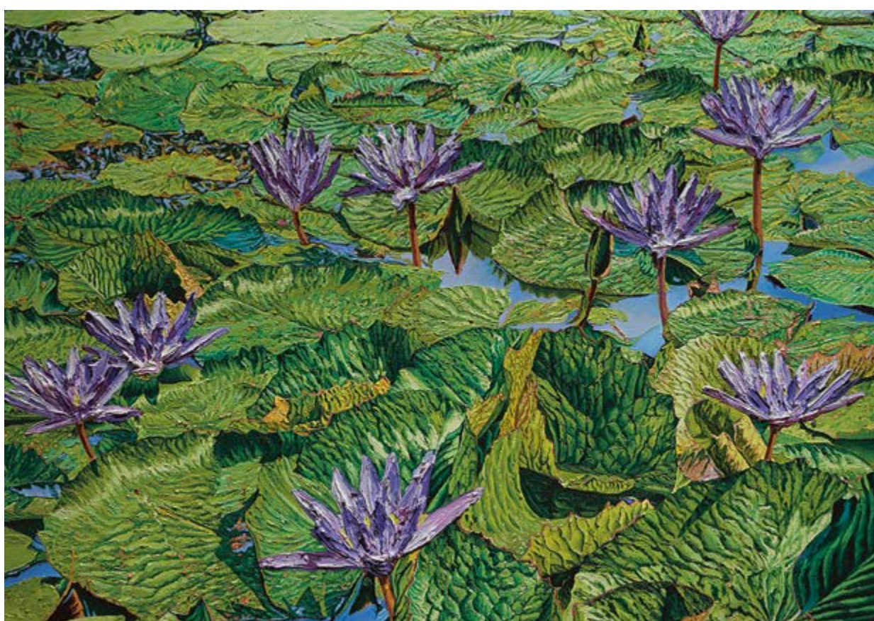
Nymphaea cerulea, 2023, 120×170 cm, olej na plátně / Öl auf Leinwand