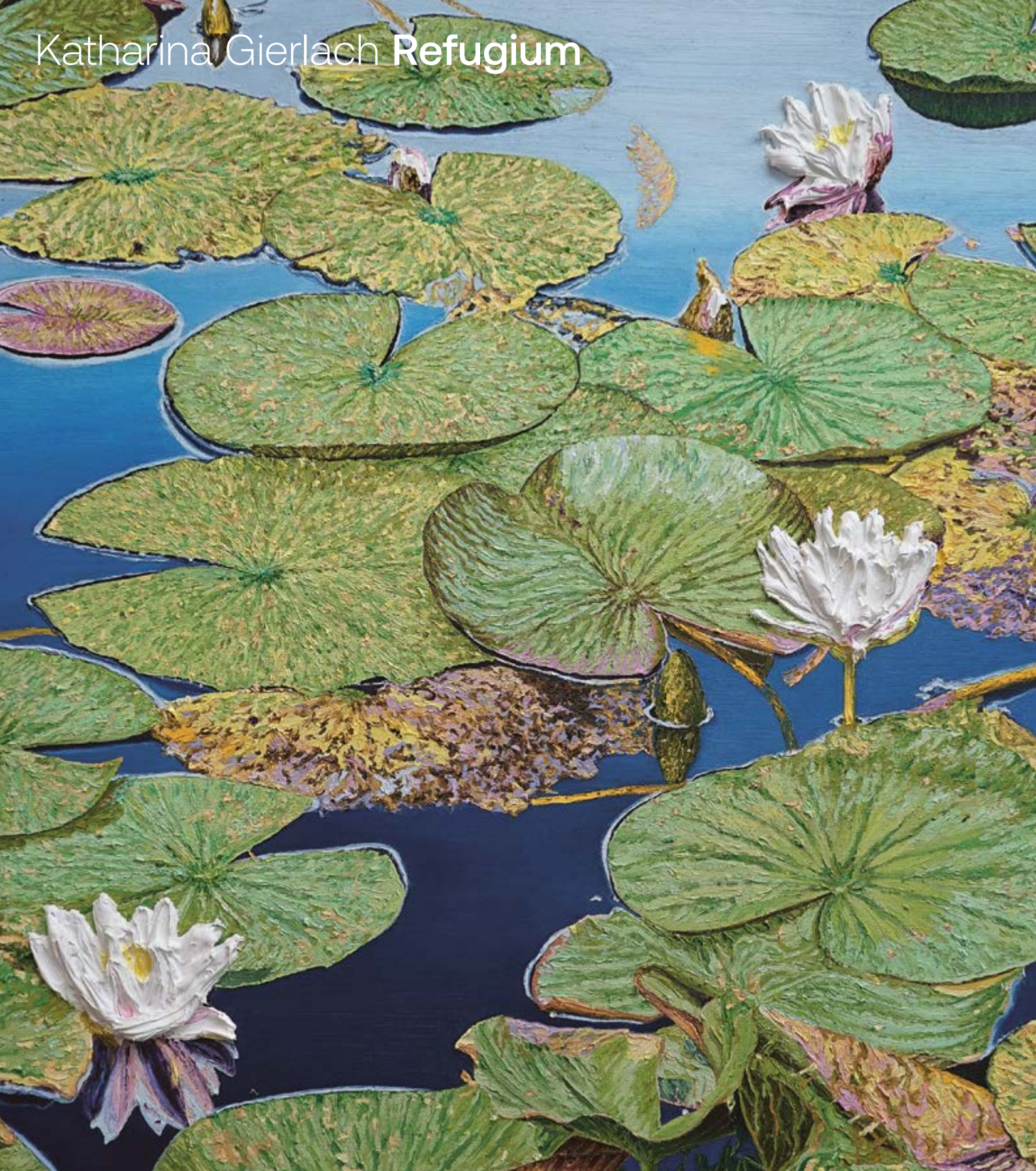
Český Krumlov / Krummau, 2023, 100×90 cm, olej na plátně / Öl auf Leinwand

Galerie výtvarného umění v Chebu 10. 4.–22. 6. 2025 vernisáž ve středu 9. dubna v 17.00