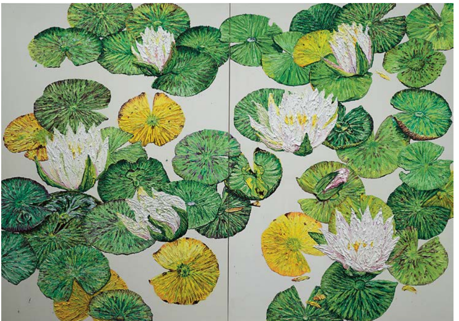
Texas Dawn, 2018, 2×170×120 cm, olej na plátně / Öl auf Leinwand