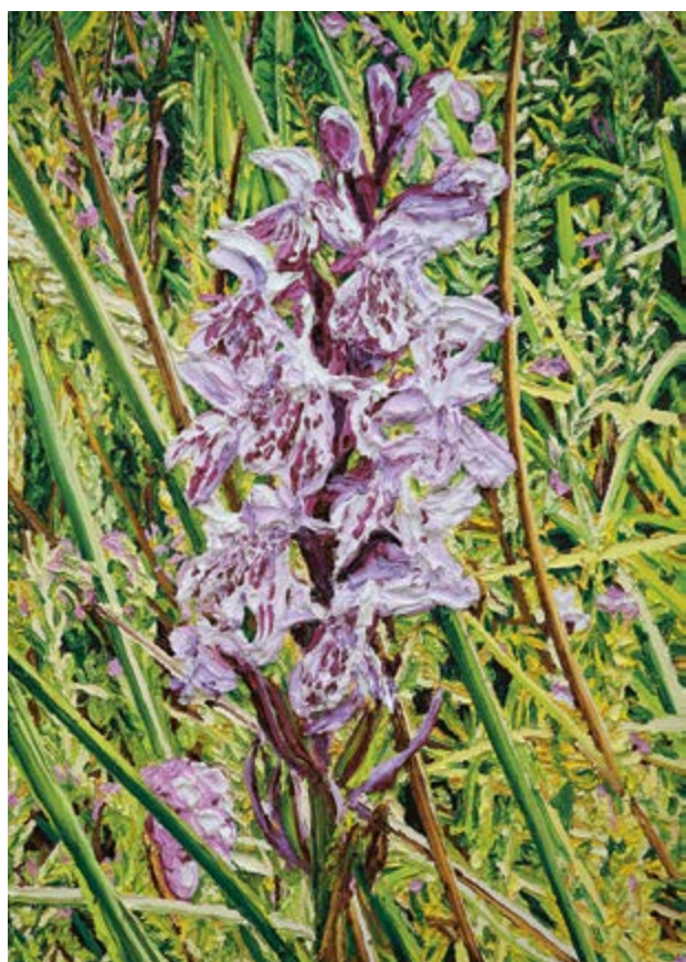
Dactylorhiza maculata, 2022, 170×120 cm, olej na plátně / Öl auf Leinwand