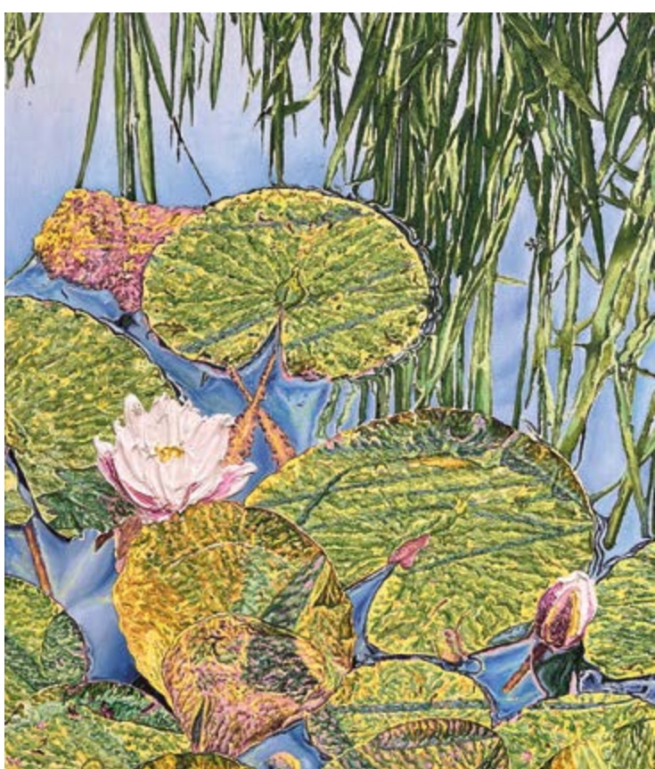
Königshain, 2024, 105×90 cm, olej na plátně / Öl auf Leinwand

Katharina Gierlach, Refugium GAVU Cheb, Malá galerie / Kleine Galerie 10. 4.–22. 6. 2025 Kurátorka / Kuratorin Kirsten Remky Otevírací doba / Öffnungszeiten: út – ne / Di – So 10.00–17.00