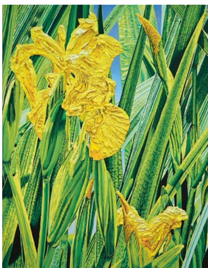
Kosatec žlutý / Sumpf-Schwertlilie (Iris pseudacorus), 2023, 180×140 cm, olej na plátně / Öl auf Leinwand

Katharina Gierlach findet die Motive ihrer Seerosenbilder in Parkanlagen, Naturschutzgebieten und privaten oder botanischen Gärten. Seerosenteiche bieten Rückzugsorte für Besucher und dienen als Schutzzonen für Pflanzen. Schönheit und Ruhe strahlen die auf dem Wasser treibenden Blüten aus. Seerosen sind Wassergewächse mit der Besonderheit, dass sie den Grenzbereich Erde, Wasser und Luft verbinden und mit positiver Symbolik verhaftet sind. Der botanische Name „Nymphaea“ leitet sich aus der antiken Mythologie ab, die die Verwandlung einer Nymphe in eine Seerose beschreibt.