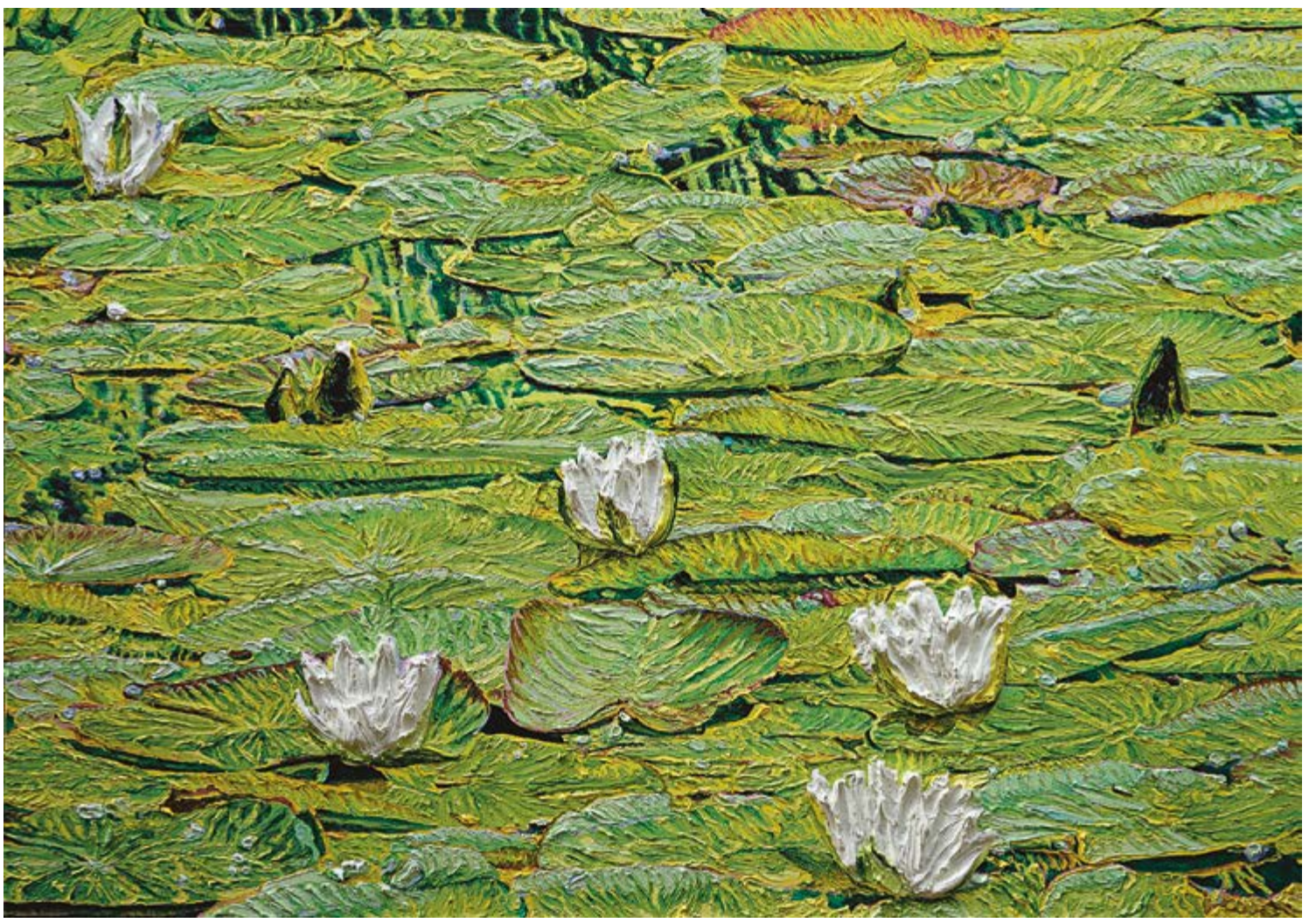
Nymphaea alba, 2023, 120×170 cm, olej na plátně / Öl auf Leinwand